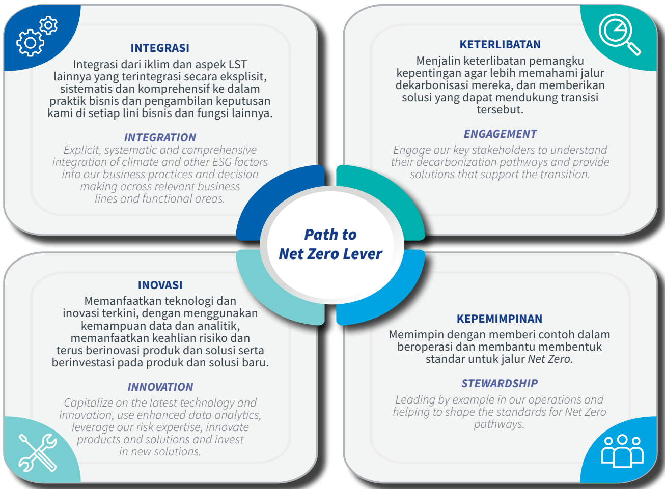
Figure 3. Path to Net Zero Lever